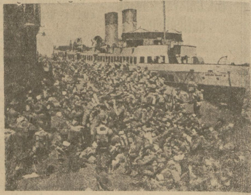
İngiliz Kıtalarının Bir İhraç Hareketi